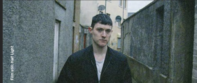
Film still: Half Light

Drama / Comedy / Animation / Music Video / Documentary (Concert details: page 20)