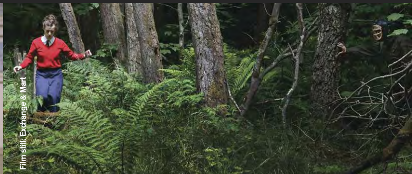
Film still: Exchange & Mart

Drama / Comedy / Animation / Black Comedy