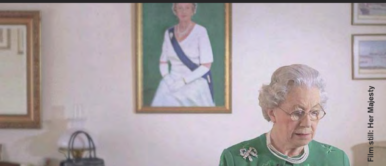
Film still: Her Majesty